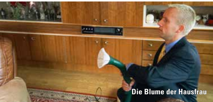
Die Blume der Hausfrau

Der Termin für alle, die gerne schon früher ins Kino gehen – in Zusammenarbeit mit der AWO Nürnberg. Ab 13 Uhr ist die Kinokneipe für Kaffee und Kuchen geöffnet!